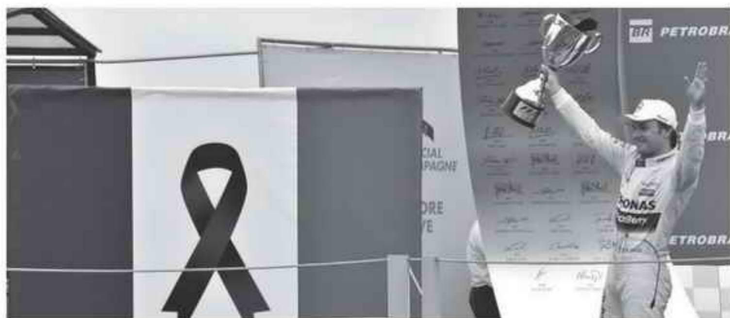
RAYAKAN KEMENANGAN- Pebalap Mercedes, Nico Rosberg merayakan kemenangan di F1 Brasi, Minggu (15/11).